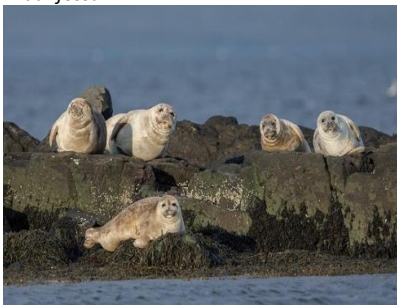
Phoques sur la péninsule de Vatnsnes