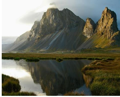
Baie de Lónsvík