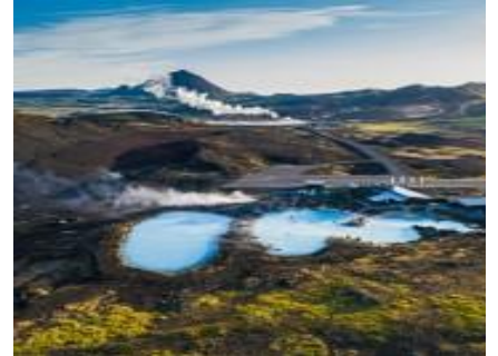
Mývatn Nature Baths