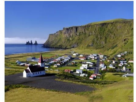
Vík í Mýrdal